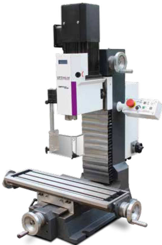
Abb.: MH 25V