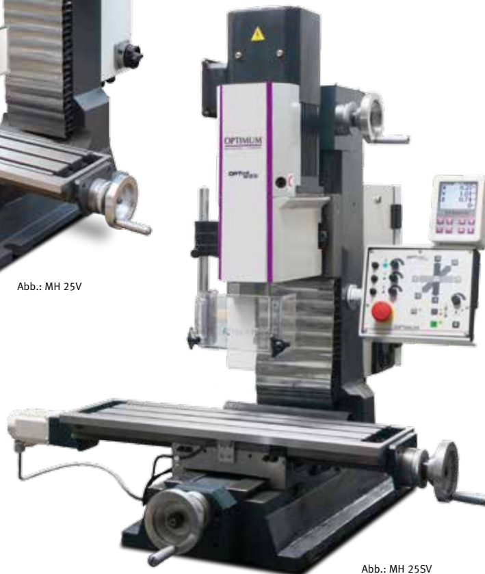
Abb.: MH 25SV